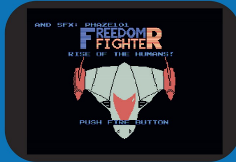
Freedom Fighter (MSX)