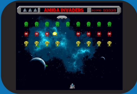
Amiga Invaders (Amiga)