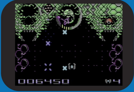
Nucleo 448 (C64)